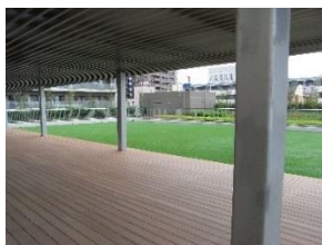
ウッドデッキ・テラス