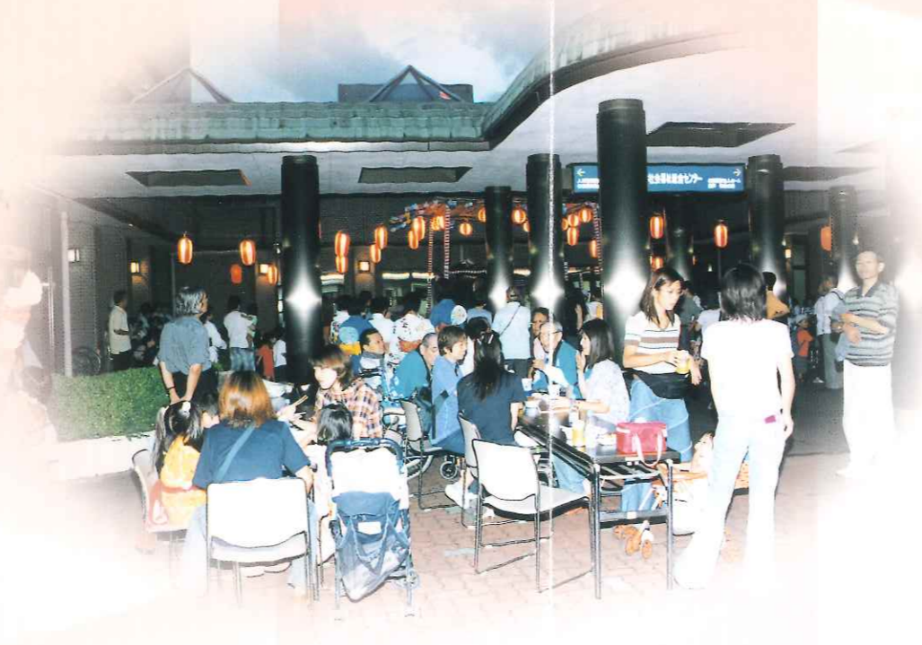
長沢壮寿の里 夏祭り風景

在宅の高齢者やその家族等に対して、いろいろな御相談に応じ、ニーズに対応した保健・福祉サービスが受けられるよう、各機関との調整や援助を行います。