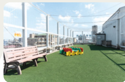
クラス毎に楽しい活動、眺めも抜群