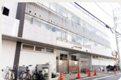
複合施設を活かし園児・利用者が楽しく交流