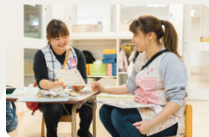
先輩、後輩関係なく、小さな事も相談しやすい!

やりたい!やってみたい!気持ちを100%応援してくれる仲間 小さなことでも相談しやすいフレンドリーな職員が魅力です