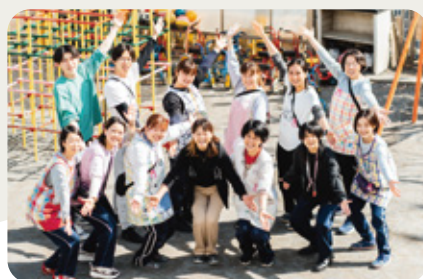
職員全員笑顔いっぱい!元気いっぱい!