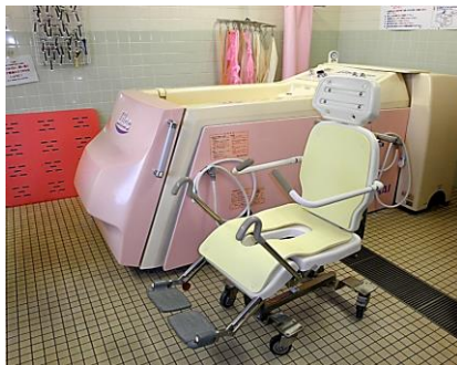
イスに座って入るお風呂です