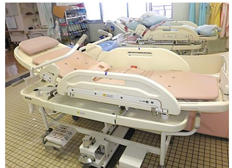
横になって入るお風呂です