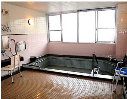
銭湯のようなお風呂です